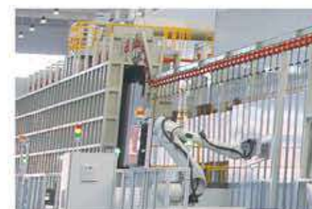
全自动静电喷涂生产线