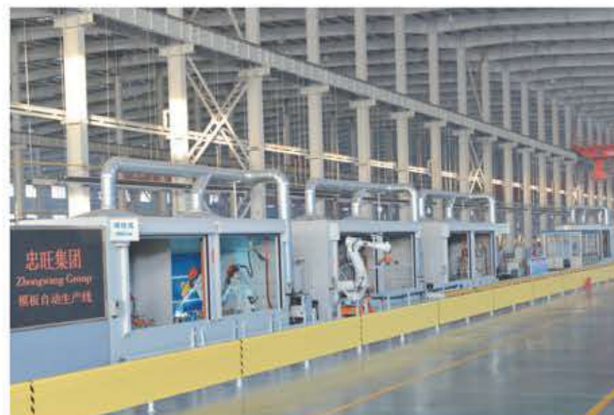
模板加工智能生产线