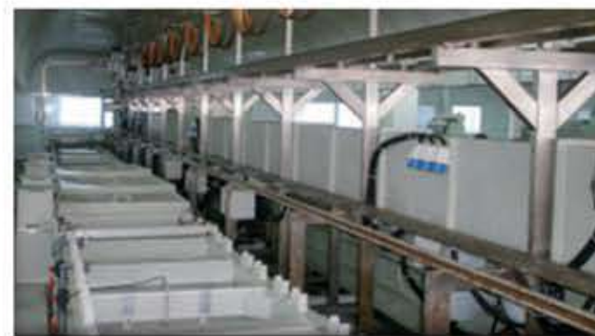
美国 Q-FOG 腐蚀设备

作为公司的战略合作伙伴忠旺集团拥有国家级企业技术中心、国家地方联合工程研究中心、国家级博士后工作站、省级工程技术研究中心及重点实验室等机构。应用技术团队1400人，产品研发团队600人，铝合金模板模架项目共投入研发经费2.6亿元。并且在2017年3月，忠旺集团投资1.2亿元建成四条自动化生产线，每条生产线最高日产量达到了1200吨。2018年，忠旺集团投资3千万元开发了基于BIM平台的铝模板三维辅助设计软件。